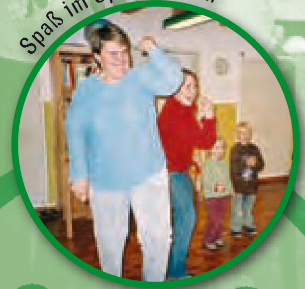
Spaß im Spiel erleben