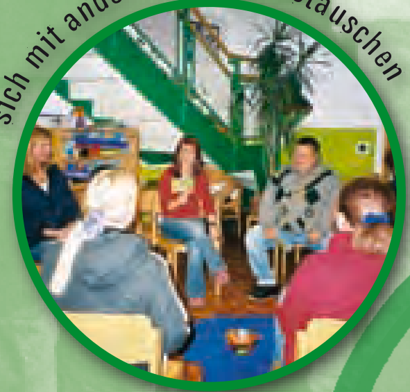
sich mit anderen Eltern austauschen